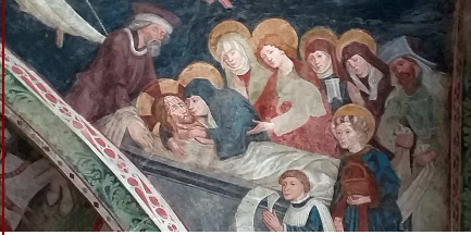
Im Kreuzgang in Brixen: die Grablegung Jaus

mit-leiden - aushalten berühren - trösten weinen - schweigen ... wie die Frauen bei dir deinen Tod aushalten dich halten sich aneinander festhalten hoffen – warten - ahnen dass aus dem Grab neues Leben wächst die Bäume grünen schon